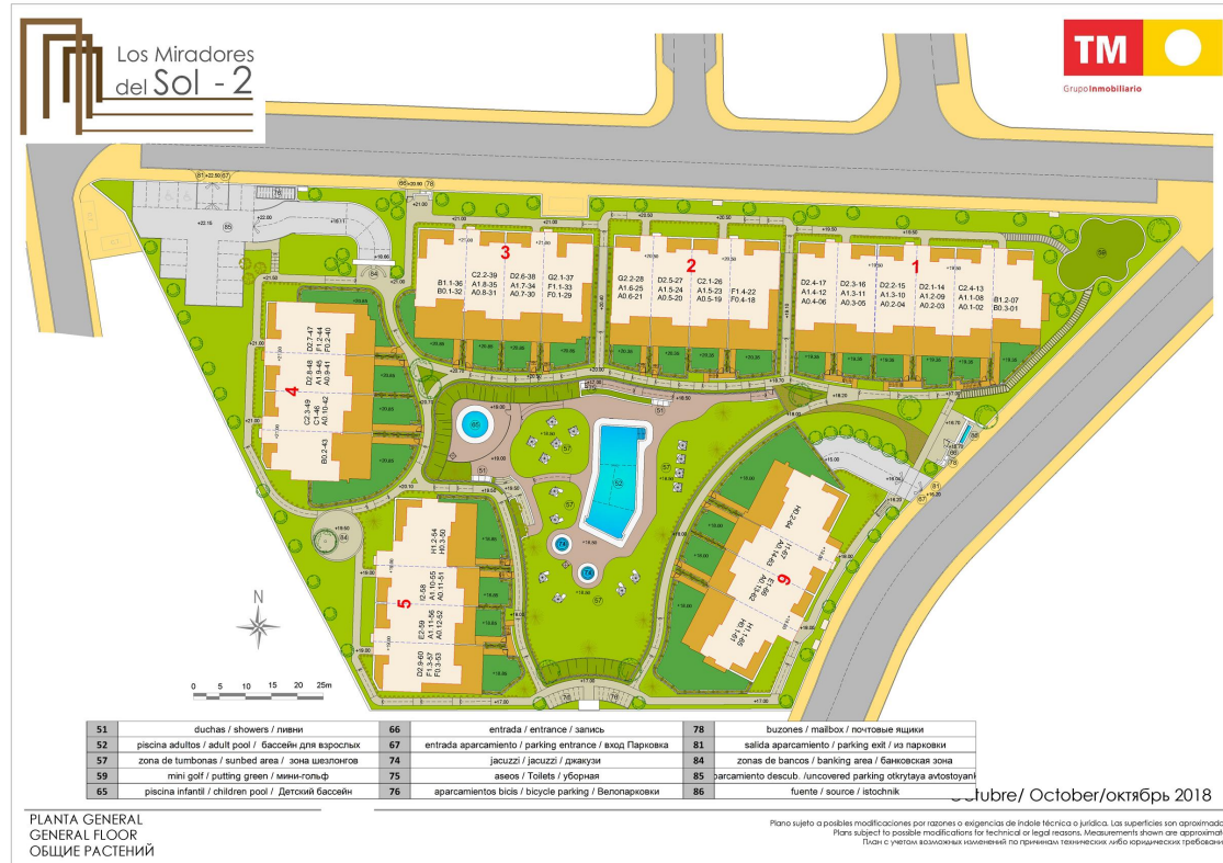
PLANTA GENERAL GENERAL FLOOR ОБЩИЕ РАСТЕНИЯ